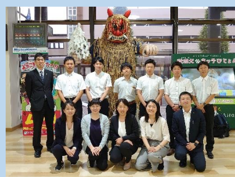
←小学校で研修した皆さん