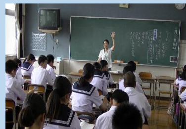
中学校で研修した皆さん→